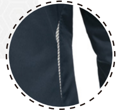
REFLECTANTES EN ESPALDA

Nuestra PARKA RALCO con excepcional capacidad de abrigo sin ser pesado ni voluminosa. Con buen nivel de repelencia y transpirabilidad.