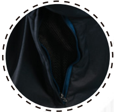
VENTILACIÓN CON CIERRE Y MESH